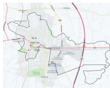
Figur 1 Hjørring Købstad 1840

Du finder HistoriskAtlas på: https://historiskatlas.dk/ .